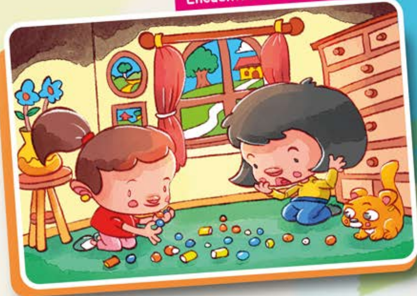
Encuentra las diferencias