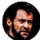
Hugh Jackman Wolverine