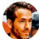
Ryan Reynolds Deadpool