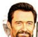
Hugh Jackman 24 años y 119 días