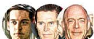
Tobey Maguire, Willem Dafoe y J.K. Simmons 19 años y 225 días