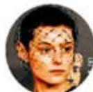
Emma Corrin Cassandra Nova