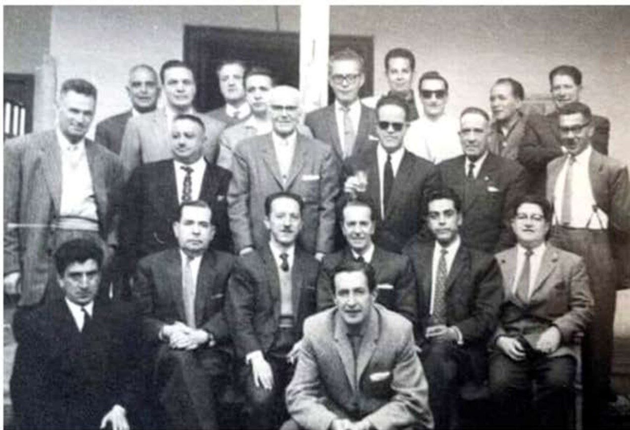
Histórica fotografía de distinguidos profesores de la Escuela de Medicina; algunos de ellos, también colaboraban con la Escuela de Farmacia.