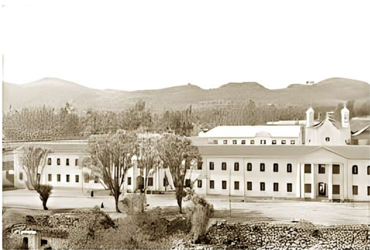
El antiguo Hospital "San Vicente de Paul" entidad solidaria que era patrocinada por la Asistencia Social