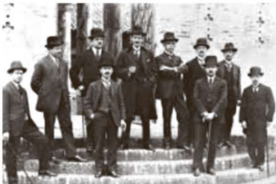
Grupo de distinguidos docentes de la Escuela de Medicina que posan al ingreso del portal principal.

darse importancia a la asistencia hospitalaria, aun cuando ésta se reducía en anotar la receta y prescripción del Jefe de Sala, asunto que ya era bastante. Nació por fin la curiosidad científica por conocer las lesiones en el cadáver que producían las enfermedades; se hacía furtivamente autopsias y nacía la Anatomía Patológica. Pero lo que más dio impulso a los estudios médico-quirúrgicos fue la presencia en