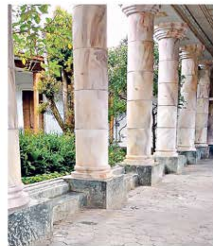
Aun quedan gratos recuerdos de ese importante centro universitario.

Cuenca de Médicos que habían logrado salir del país y practicar en centros avanzados como en Francia o Alemania. En 1912, la presencia del Dr. Isidro Ayora Cueva, aunque por poco tiempo, sirvió para que por medio de algunas operaciones que realizó, indudablemente por primera vez en la ciudad: extirpación de hernia estrangulada, trepanación craneana, etc., lo cual dejó el terreno preparado