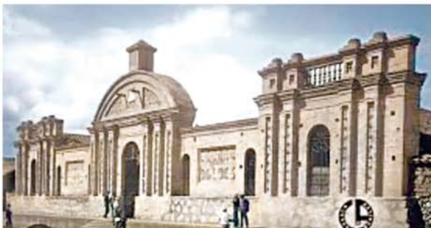
Edificio en el cual funcionaba la Escuela de Medicina de la Universidad de Cuenca. (Av 12 de Abril y Fray Vicente Solano)

En el patio principal estaban contruidos seis cuartos para clases. Entre ellos: Una sala amplia, el Gabinete de Bacteriología y que estaba previsto de todo lo necesario, en otra la de Química. En una sala contigua funcionaba la Secretaria de la Escuela. En las subsiguientes estaban destinadas para las otras asignaturas principales y también se proyectaban, el Gabinete de Ciencias Naturales y el Jardín Botánico. Los alumnos solían concurrir al Hospital "San Vicente de Paúl" que estaba contiguo a la Escuela de Medicina para el respectivo estudio práctico bajo la dirección de sus profesores. Las preparaciones anatómicas y demás estudios se realizaban en cadáveres que salían del Hospital. De este modo, lo estudiado en un enfermo se complementaba con el que se observaba en el cadáver. A principios del segundo decenio del siglo que decurría hubo un despertar de la conciencia estudiantil, por el adelanto y progreso de los estudios. En consecuencia, empezó a