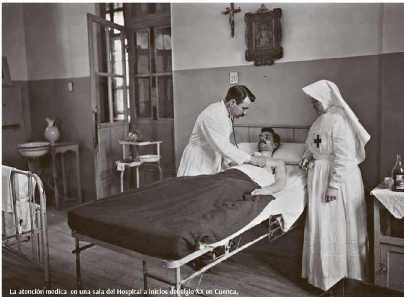
La atención médica en una sala del Hospital a inicios del siglo XX en Cuenca.

Los pocos médicos que ejercían, comparaban su tiempo entre la cátedra, el hospital y las visitas domiciliarias de sus pacientes. Amerita señalar que en los albores del siglo XX, la medicina occidental convivía con la medicina tradicional o aborigen y que tenía mayor atención porque la Provincia del Azuay era mayoritariamente indígena. Predominaban las comadronas o parteras, los curanderos y los llamados "hábiles", los pobres y la gente del sector rural acudía a los Hospitales de la Caridad. El consultorio del médico se acomodaba en el mismo domicilio, en las viejas casas coloniales que poseían.