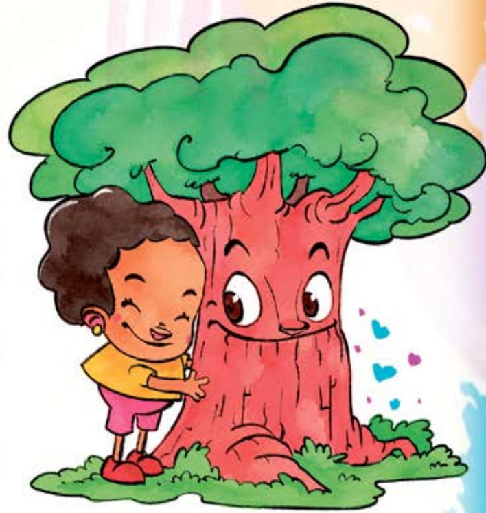
nutrientes a través de una red de hongos llamada "Wood Wide Web".

SABÍAS QUÉ: • Los árboles se comunican bajo tierra y comparten